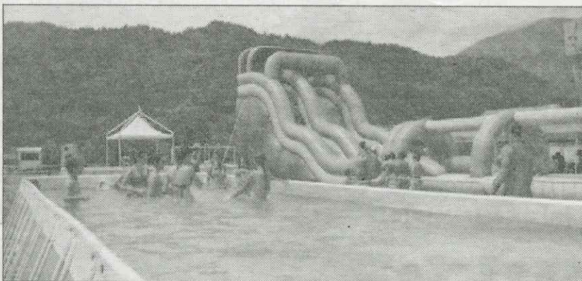
Al polisportivo ieri i giochi d'acqua e la palestra artificiale di arrampicata