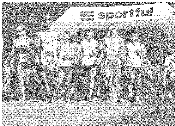
La partenza del duathlon di Arsiè

In campo femminile una sola squadra al via, quella