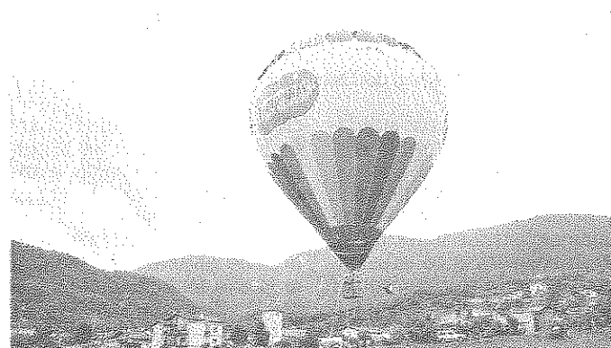
La mongolfiera della manifestazione