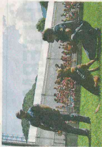
L'esibizione del cane poliziotto Zoe