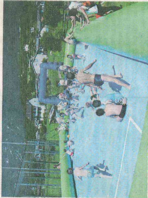
Ci si diverte sul campo del calcio saponato

I più grandicelli si sono scatenati nel campo per il calcio saponato o nella piscina più ampia, sorvegliata dai bagnini così come tutte le altre. Per i bambini da zero a sei anni è stato creato un baby club con una provvidenziale tettoia per proteggere i più piccoli dal sole che batteva forte. Anche giochi e piccoli scivoli per catturare l'attenzione concedendo così qualche momento di libertà a mamme e papà. Già attivi alcuni stand delle specialità sportive presenti, co-