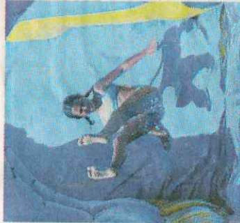
Lo scivolo acquatico