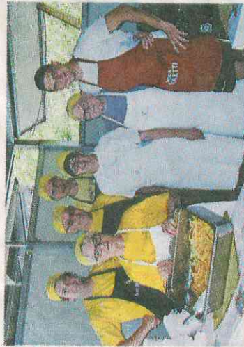
La squadra dei cuochi alla Summer Fest di Arsiè